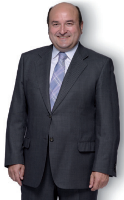
ANDONI ORTUZAR. CANDIDATO POR BIZKAIA DE EAJ-PNV

Este es el modelo de la recuperación y el crecimiento de Euskadi. Piénsatelo bien, el día 21 de octubre tenemos que decidir un futuro mejor para Ezkerraldea y Meatzaldea, un futuro mejor para todas y todos. Este es el compromiso de EAJ-PNV.