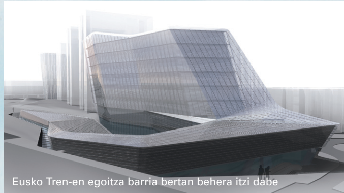
Eusko Tren-en egoitza barria bertan behera itzi dabe

Y la prioridad hoy y ahora son los ciudadanos y ciudadanas de Bizkaia. ¡Castro puede esperar; Bizkaia, no!